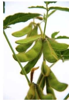
LfL, Schweizer G.

Die Teilnahme an der Veranstaltung (inklusive Verpflegung) ist kostenlos. Um die Versorgung besser planen zu können, bitten wir um Anmeldung bis zum 11.02.2023 unter (kurzfristige Anmeldung ohne Verpflegung dennoch möglich): https://www.lfl.bayern.de/ipz/oelfruechte/344608/index.php