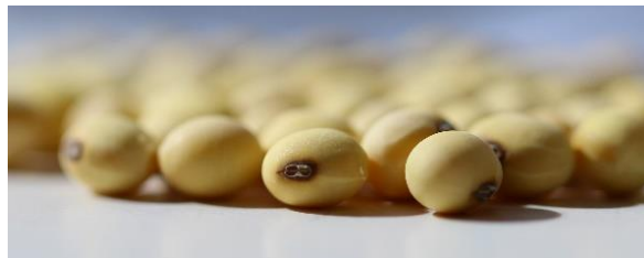
LfL, Schweizer G.

Während der Veranstaltung werden Fotos für unsere Öffentlichkeitsarbeit aufgenommen, auf denen Sie gegebenenfalls zu erkennen sind. Bitte teilen Sie uns zu Beginn der Veranstaltung mit, wenn Sie mit einer Aufnahme Ihrer Person nicht einverstanden sind. Hinweis zum Datenschutz siehe unten.