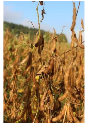
LfL, Benda J.

Die Sojabohne ist die Hülsenfrucht, die aktuell auf bayerischen Äckern am stärksten vertreten ist. Dies liegt an einem mittlerweile gut etablierten Anbau und der Zulassung vieler neuer standortangepasster Sorten. Entscheidend für die Erweiterung der Sojafläche ist nicht nur der Anbau, sondern auch die Vermarktung. Durch die steigende Nachfrage nach gentechnikfreiem und regional erzeugtem Soja entwickeln sich neue Absatzwege. In unserer Veranstaltung möchten wir Landwirte*innen über den Anbau , Möglichkeiten der Absatzwege und Perspektiven von konventionell und ökologisch erzeugtem Soja informieren.